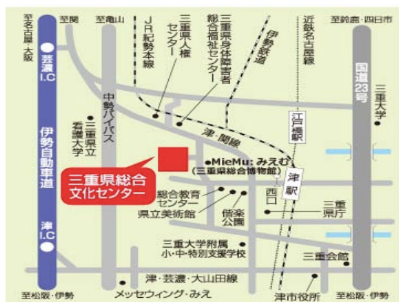
三重県津市一身田(いっしんでん)上津部田(こうづべた)1234番地